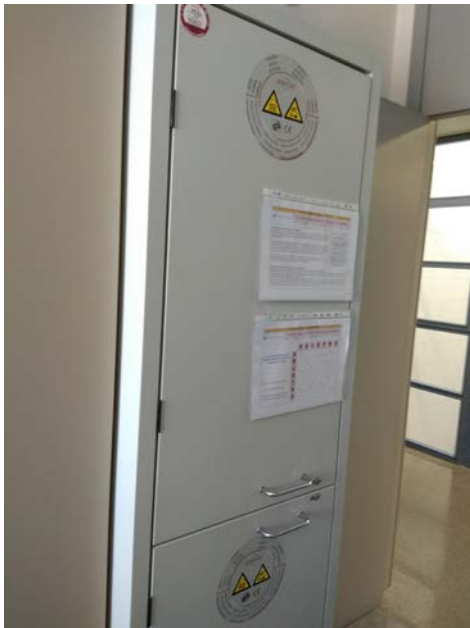
Armari d'emmagatzematge de productes químics