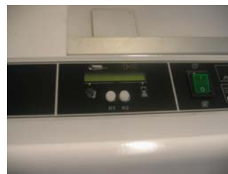
Tauler de control