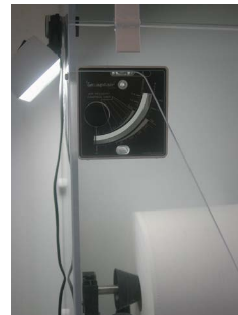
Mesurador de velocitat de l'aire