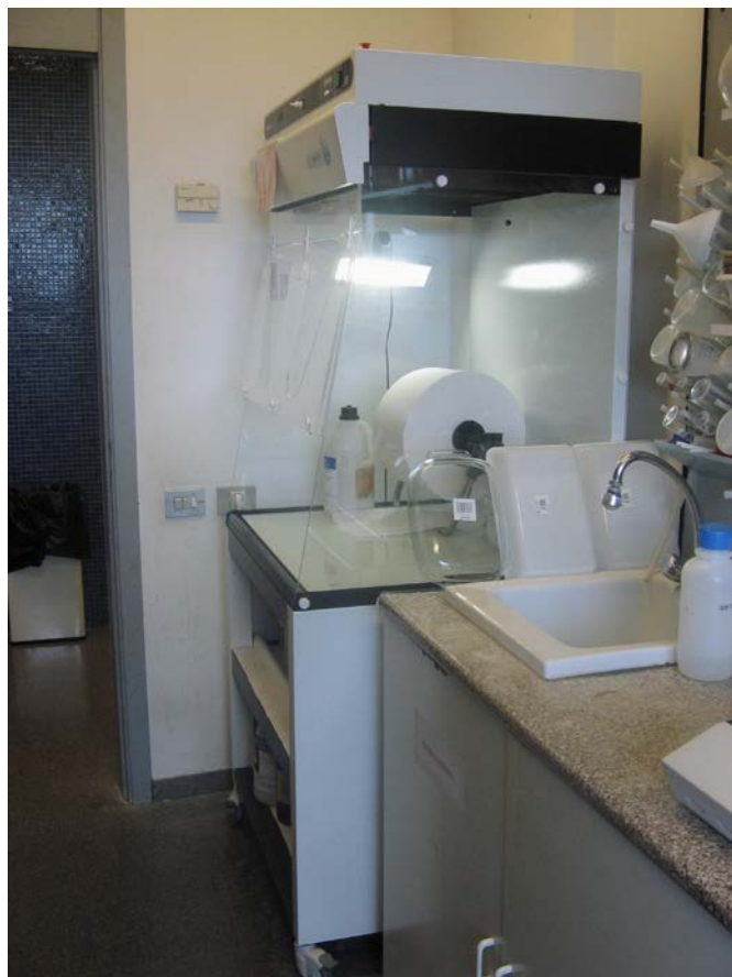
Cabina d'extracció de gasos