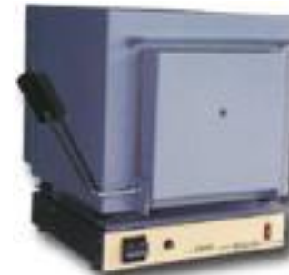
Forn elèctric de mufla

Les estufes poden treballar fins a 450 °C.